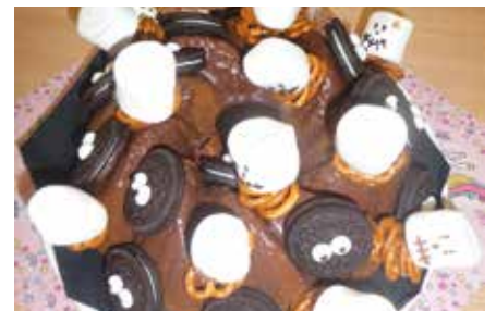
Ob der gruselige Kuchen denn schmeckt?