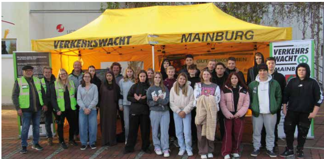
Die Schülerinnen und Schüler der 9. Klasse