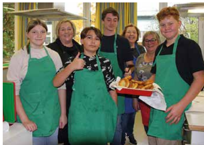
Die fleißigen Bäcker mit ihren Helferinnen.