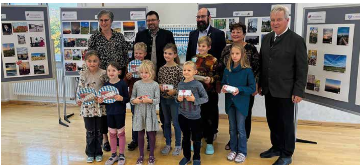
Die strahlenden Siegerinnen und Sieger des Fotowettbewerbes