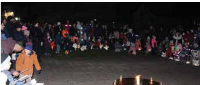
Der ganze Garten war voll, lauschte und sang zu Ehren von Sankt Martin