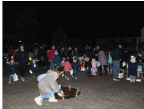
Gerne haben wir die Einladung angenommen, im Garten des Seniorenheims unsere Andacht gemeinsam zu feiern