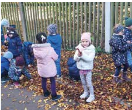
Auf unserem Spaziergang fanden wir die Schätze des Herbstes überall herumliegen

Zum Herbst gehört aber auch das Martinsfest, dass wir in diesem Jahr mit Geisterlaternen und einer Andacht im Seniorenheim feiern durften. Wir bekamen auch die traditionellen Martinsbrote vom Markt und der Elternbeirat hatte unseren Garten in der Kindertagesstätte wieder so wunderbar hergerichtet, dass wir gar nicht mehr nach Hause wollten. Vielen Dank dafür! So – jedenfalls finden wir Kinder – kann der Herbst gerne noch ein wenig bleiben!