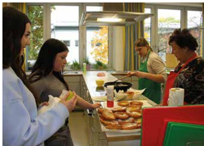
Die fertigen Kiacherln werden in die Klassen gebracht.