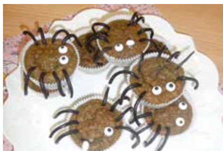
Hoffentlich laufen die Spinnen nicht weg, bevor sie von uns verschlungen werden