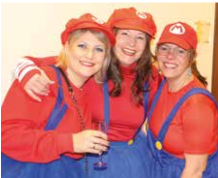
3 x Mario