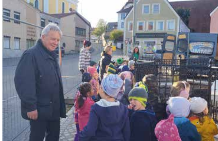
Der Bürgermeister kam als Unterstützung zu unserer Probe für das Fest