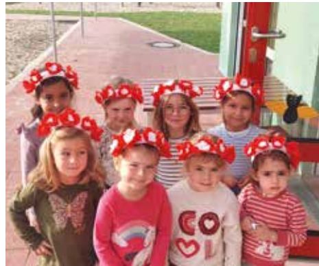
Die Mädchen haben sich mit Blumenkränzen zum Feiern geschmückt