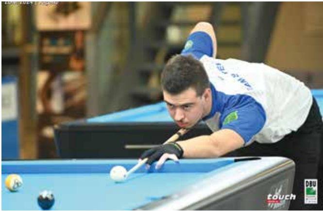
Robin voll konzentriert beim Billardspielen

TEXT: ANTON FISCHER