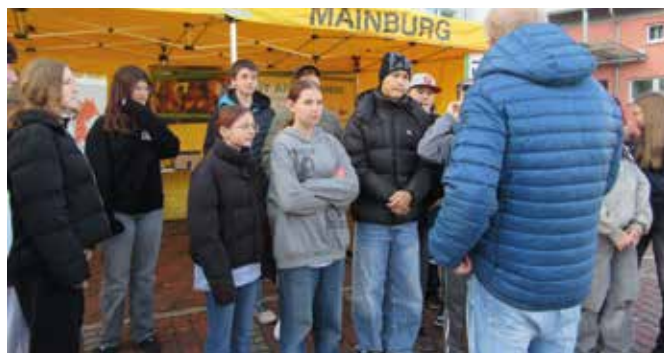
Herr Zehentmeier informiert alle vorab