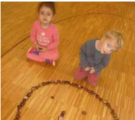
Die Kastanien werden nicht nur gesammelt, wir nutzen sie auch für Spiele beim Turnen oder zum Legen von Formen