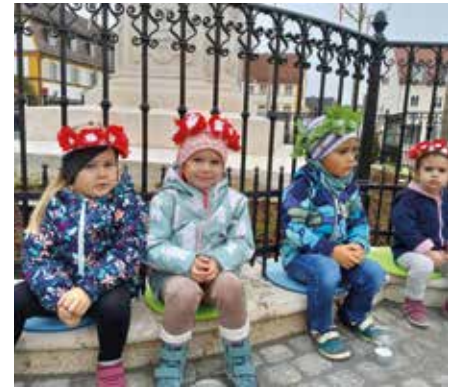
So eine wundervolle Feierstunde zur Segnung der Mariensäule gibt es sicher nur einmal im Leben