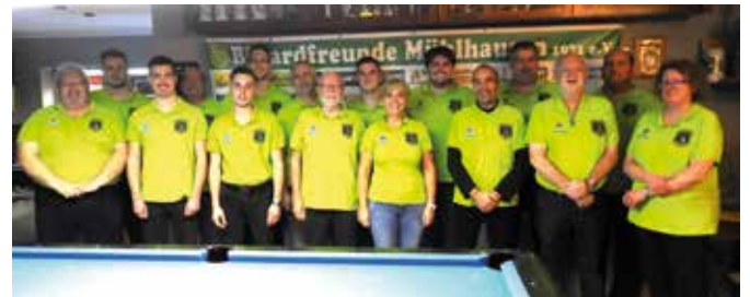
Die Teilnehmer der Doppel-Vereinsmeisterschaft 2024