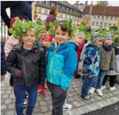
Bei unseren Marienliedern trugen die Buben Hopfenkränze, passend zu unserer Holledau