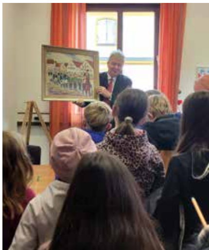
Im Büro des Bürgermeisters