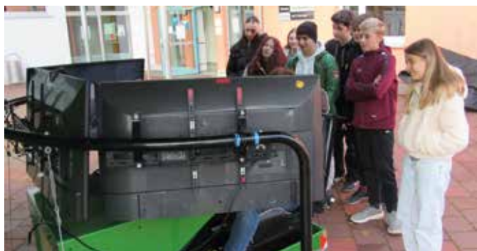
Die Schüler beim Fahrzeugsimulator