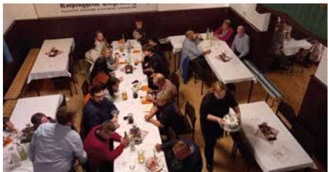
Reges Treiben im Kolpingheim