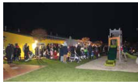
Zum Ausklang folgte das gemütliche Beisammensein bei Glühwein, Tee, Würstchen und Martinsgänsen