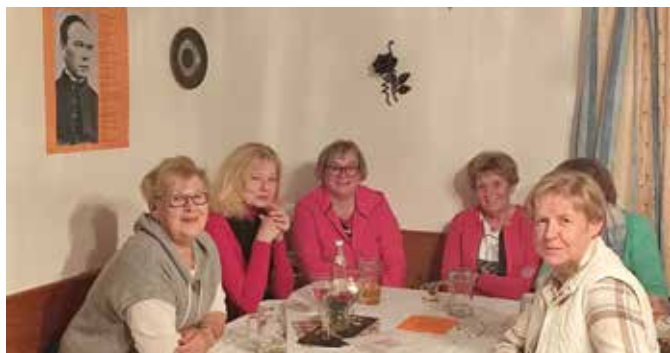
Der Frauenbund zu Besuch