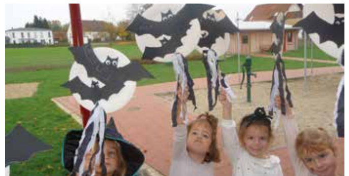
Achtung, in der Kita fliegen Fledermäuse herum!