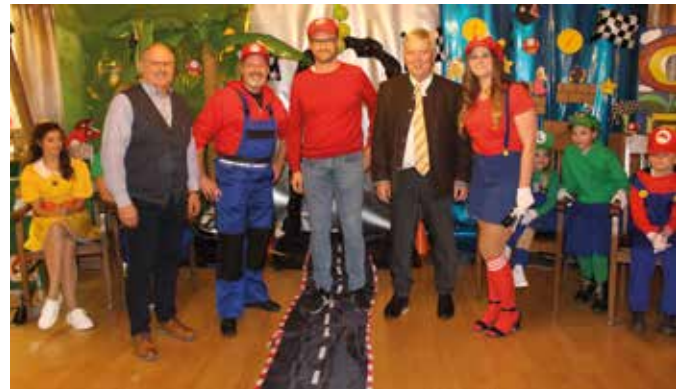
Gewinner des Spieles