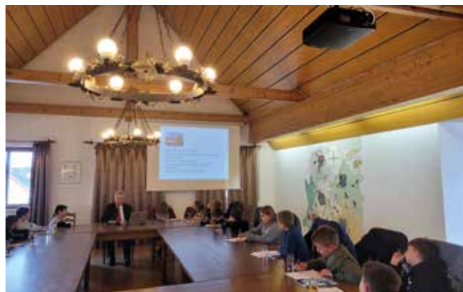
Kinder im Sitzungssaal