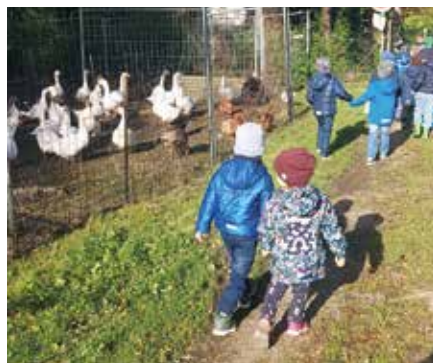
Die schnatternden Gänse erinnern uns an die Sage des Hl. Martins, der sich im Gänsestall versteckt hatte.