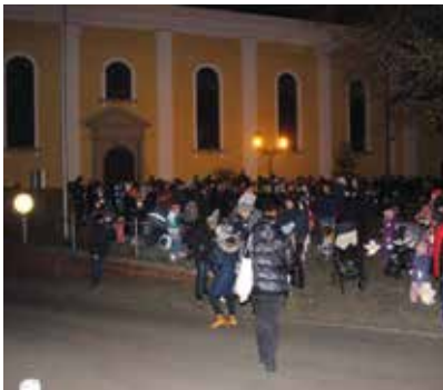
Der Laternenumzug führte uns in der Dämmerung vom Kirchenvorplatz um das Seniorenheim