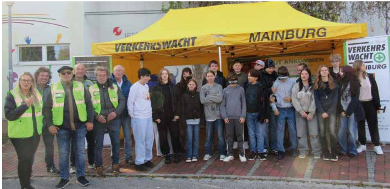
Die Schülerinnen und Schüler der 8. Klasse