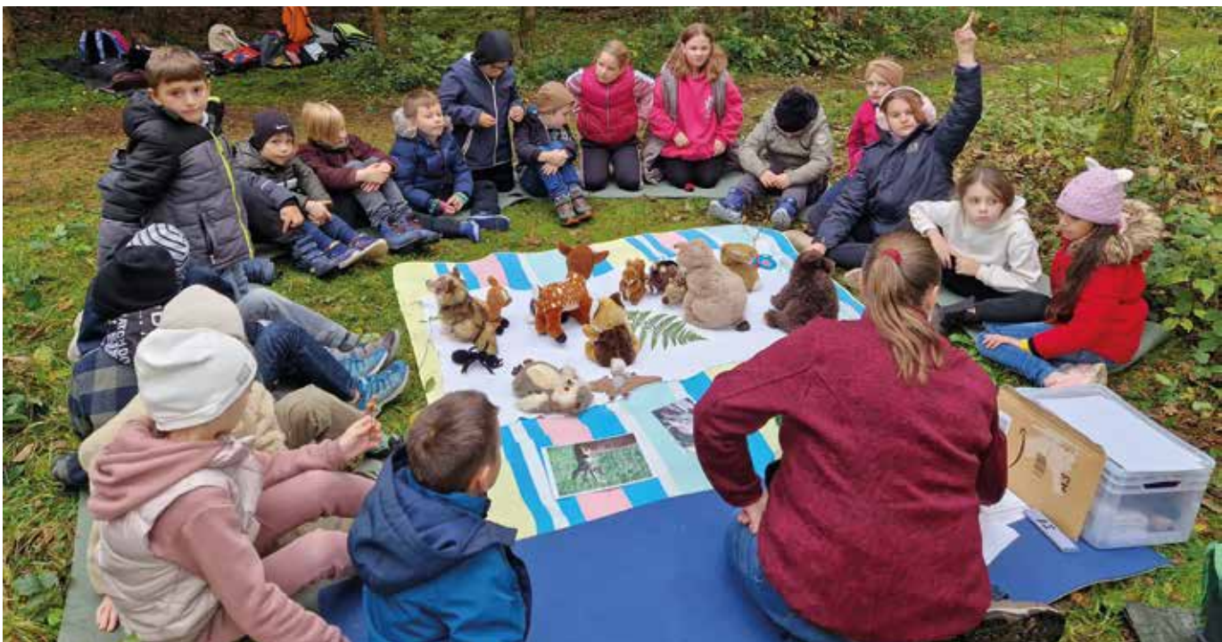
Waldtiere ganz nah