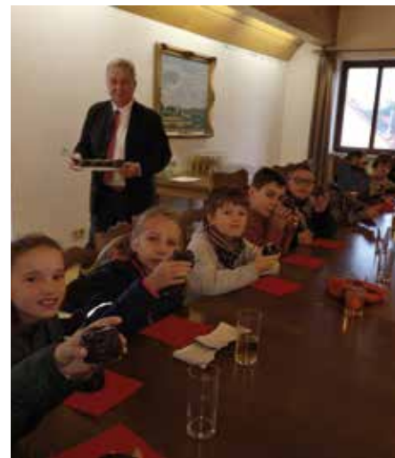
Es gibt ja leckere Kuchen!