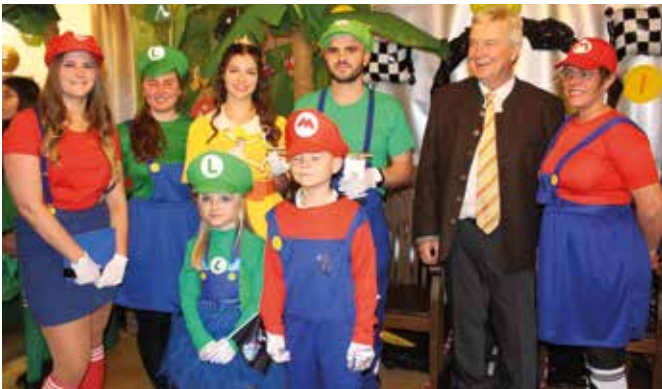
Die neuen Regenten mit Trainer und Bürgermeister