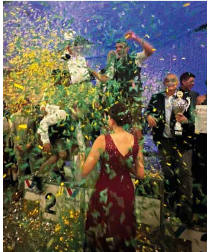
Rauschende Party im Anschluss