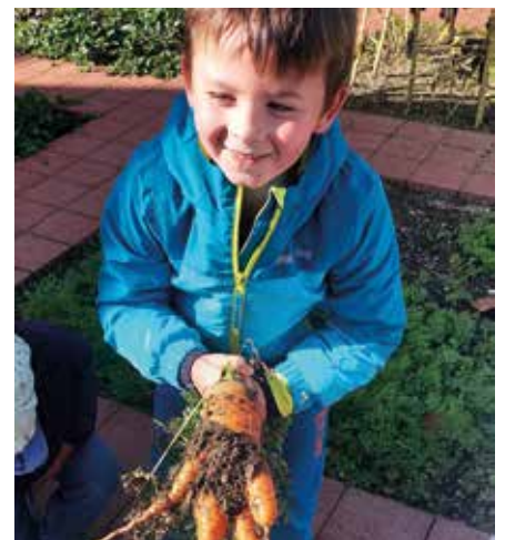
Unsere Gartenbeete werden abgeerntet und für den Winter vorbereitet