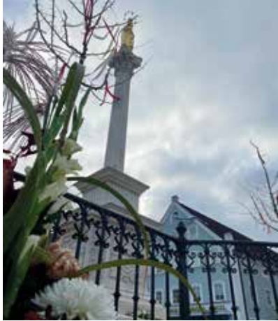
Herzlich willkommen zurück, liebe Mutter Gottes