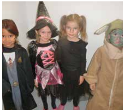
Hexen und sogar Meister Yoda waren zu Besuch in der Kita