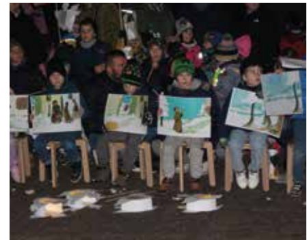
Die Vorschulkinder trugen mit ihren Bildtafeln die Martinslegende in Gedichtform vor